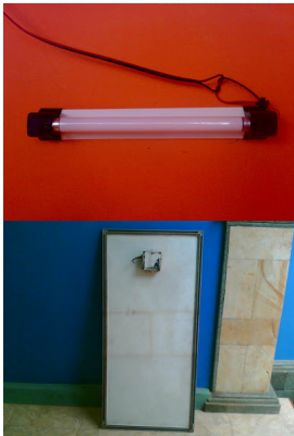
Merk R&S 50wp tampak belakang