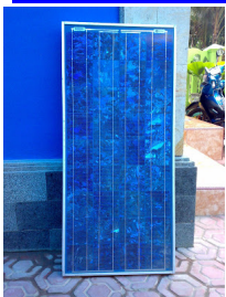
Gambar Solar Panel Merk BP-Solar 55wp

Di buat oleh SUNERGY INDONESIA JUAL LISTRIK TENAGA SURYA (solar cell) berbagai merk , kondisi SECOND/bekas, Harga Rp 1.700.000,- untuk semua merk yang 50 wp