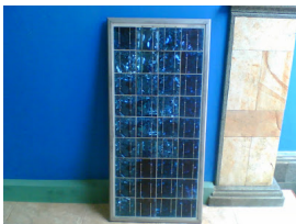
Merk R&S 50wp tampak depan

Di buat oleh SUNERGY INDONESIA JUAL LISTRIK TENAGA SURYA (solar cell) berbagai merk , kondisi SECOND/bekas, Harga Rp 1.700.000,- untuk semua merk yang 50 wp