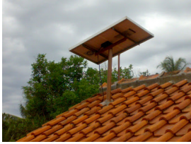
Pemasangan panel surya

Di buat oleh SUNERGY INDONESIA LISTRIK TENAGA SURYA / MATAHARI ( SOLARCELL ) , klik juga di www.indosunergy.com